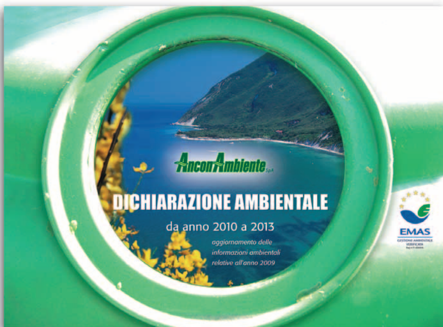
Dichiarazione Ambientale 2010-2013

L'impegno di AnconAmbiente nei confronti dei cittadini e dell'ambiente acquisisce trasparenza attraverso la registrazione EMAS dell'azienda e con la pubblicazione della Dichiarazione Ambientale .