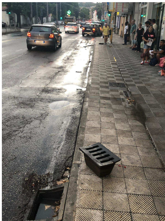
FOTONOTIZIA N. 1