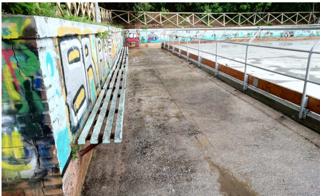
Fotonotizia n. 1