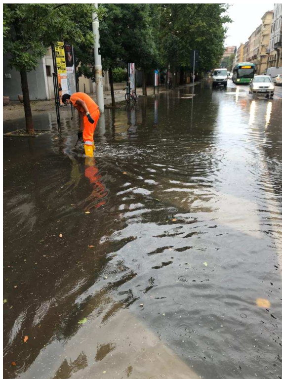
Fotonotizia n. 2