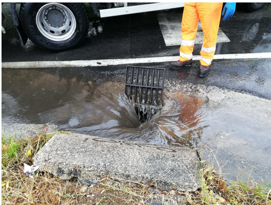
Fotonotizia n. 4