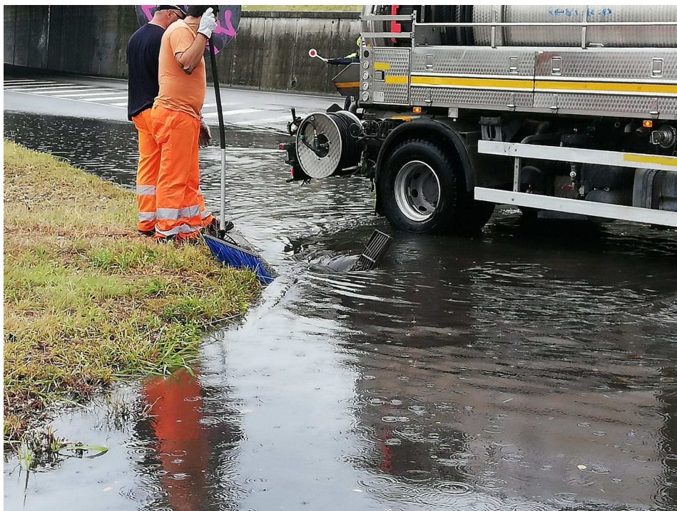
Fotonotizia n. 3