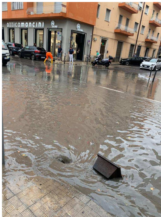
Fotonotizia n. 6