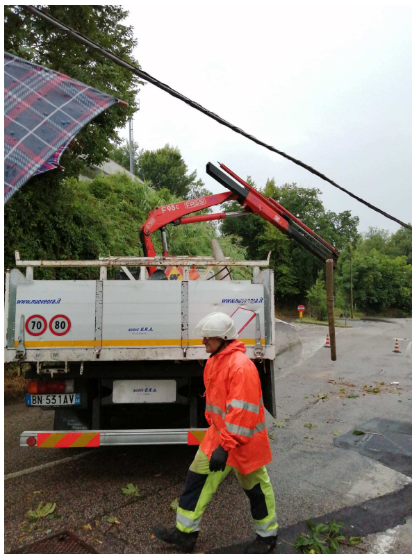
Fotonotizia n. 5