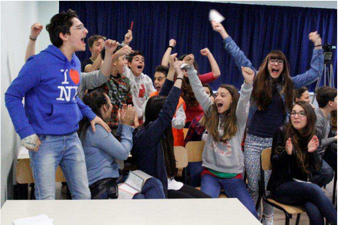
Fotonotizia n. 3