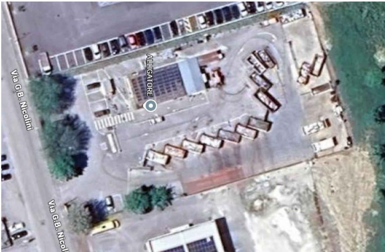
Lotto 2 Area Fabriano – Lotto 3 Tutti i territori Sede Località Fornace Sassoferrato (AN)